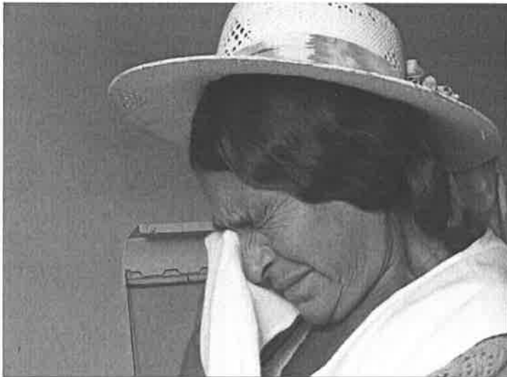
Billede 5: Gutiérrez, 22:08

Udover personlige historier ser man også samlinger af bolivianere der demonstrerer mod korrupsionen blandt politikere, da de bliver sponsoreret af kokainproducenter 51 , samt forbuddet mod koka. Her spilles der optrappende musik imens man ser en gruppe bolivianere råbe i kor.