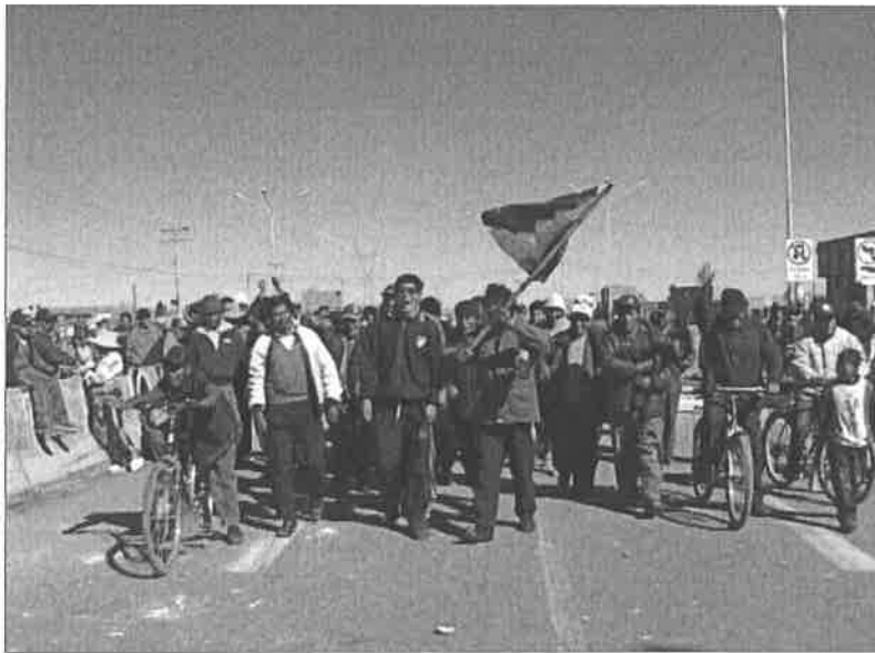
Billede 6: Gutiérrez, 15:58

Udover personlige historier ser man også samlinger af bolivianere der demonstrerer mod korrupsionen blandt politikere, da de bliver sponsoreret af kokainproducenter 51 , samt forbuddet mod koka. Her spilles der optrappende musik imens man ser en gruppe bolivianere råbe i kor.