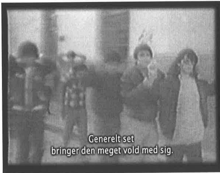
Billede 3: Gutiérrez, 11:39

poder adelantar otras políticas que son de seguridad nacional” 42 . På denne måde bliver USA sat i dårligt lys, da det virker som om, at deres rolle i kampen mod koka udelukkende er for at hjælpe dem selv. Dette billede af Vesten, og specielt USA, fortsætter videre i filmen, da Ronckens udtale bliver efterfulgt af gamle videoer af indfødte, der går med hænderne over hovedet og nogle som kunne ligne politi efter sig.