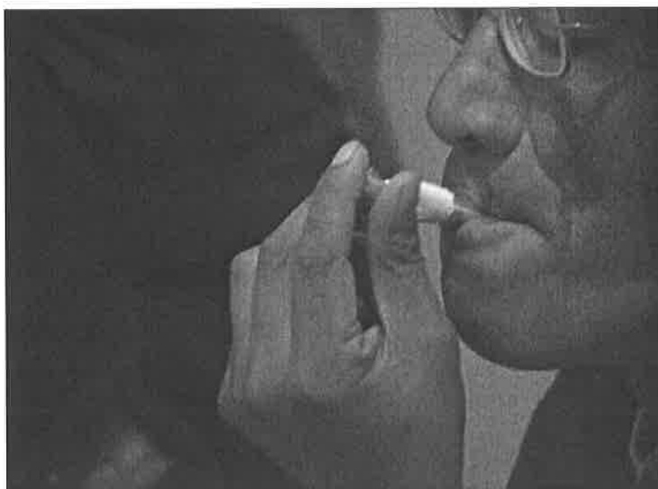
Billede 8: Gutiérrez, 24:05

Ved at skabe denne stemning omkring stoffer, kommer fuldkaben på Bolivias gader som en stærk kontrast mod dette. Dette sker gennem klippearbejdet, hvormed instruktøren med vilje har valgt at sætte alkohol op imod stoffer som værende værre for de sociale forhold i Bolivia.