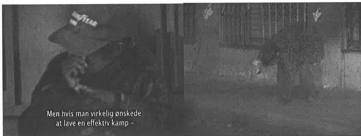
Billede 9: Gutiérrez, 26:55