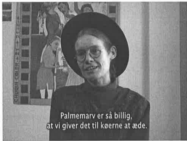
Billede 12: Gutiérrez, 31:23

Slutningen af dokumentaren er en mere dybdegående beskrivelse af alle de interviewede, så modtageren får en bedre ide om hvor meget viden den enkelte person/ekspert har omkring emnet. På denne måde formår instruktøren at skaffe de forskellige eksperter etos, da modtageren ud fra beskrivelser kan se, at de forskellige mennesker ved hvad de har udtalt sig om. På denne måde bliver det også tydeliggjort, hvilke eksperter der er for og hvilke der er imod kokaen. Så selvom at mange af eksperterne udtaler sig gennem patos, gør etos i slutningen, at deres udtalelser bliver mere troværdige, så modtageren ikke tror at de udelukkende har talt ud fra personlige holdninger.