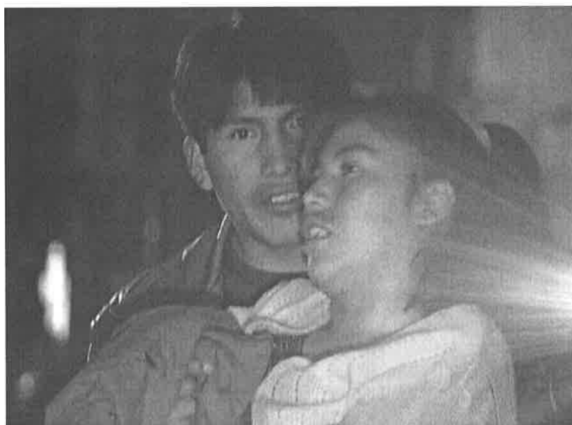
Billede 7: Gutiérrez, 25:05

Et af disse problemer er alkohol. Alkohol bliver stillet op som værende et større problem end kokain. 54 Dette gøres bl.a. ved at vise klip af fulde bolivianere på gaderne i Bolivia. Her ses bl.a. en pige som har svært ved at forblive stående selvom hun får hjælp af en anden.